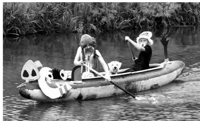
Asterix, Obelix a Idefix na Kanci