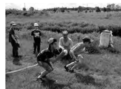
Žabí skoky u Žabky-carevny