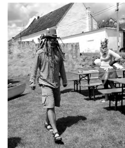
Vodník a Žabka-carevna