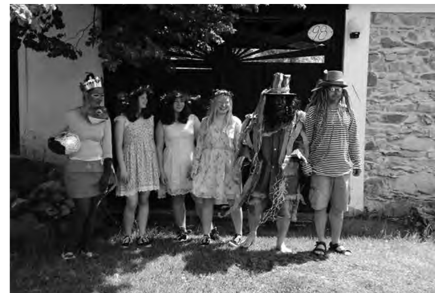
Žabka-carevna, rusalky, Jožin a vodník