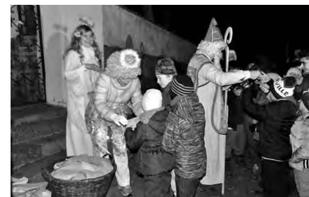
Obdarování Svätým Mikulášem a andílky