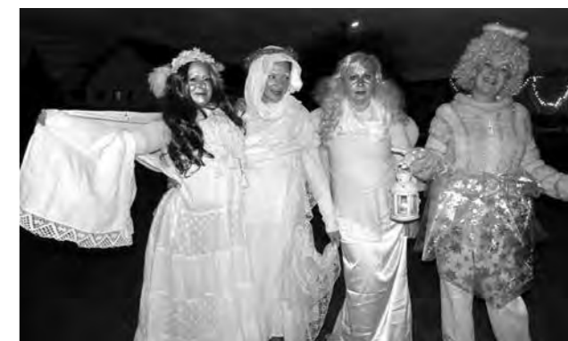
Andělé na kamenném mostě