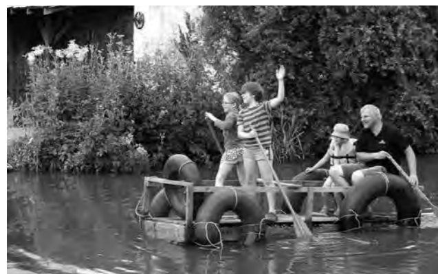
Auto na vodě