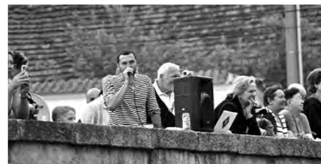
Kapitán u mikrofonu