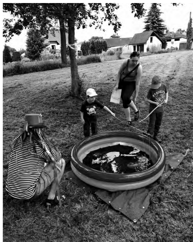
Lov ryb u vodníka

Kdo se na cestu vypravil sám, mohl si lépe užít pohádkové atmosféry krásného dne. Zpěv ptáků, vůně Blanice a chmýří poletující z topolů provázely děti na cestě, kudy většina z nich chodí jen málokdy. Po cestě se setkávaly s čarovnými vodními bytostmi a plnily jejich úkoly, za což byly na každém stanovišti odměněny drobným dárečkem.