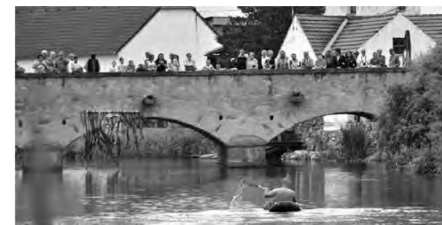
Diváci v cíli