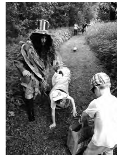
Jožin z bažin