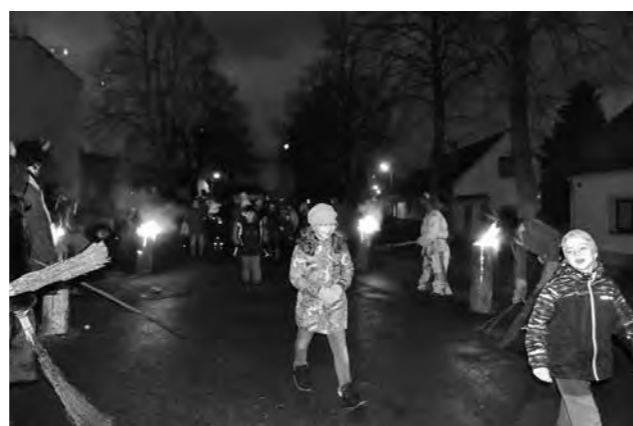
Opuštění pekla je důvod k úsměvu