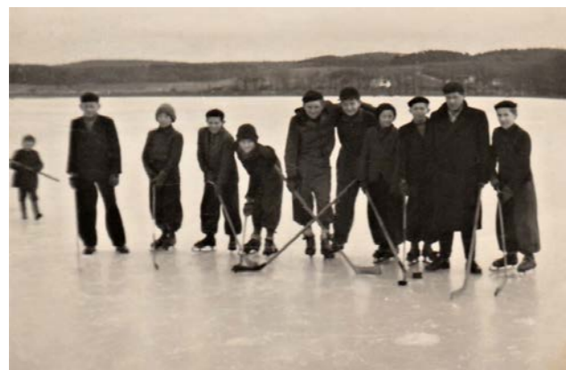
Mladí průkopníci putimského hokeje na Podkostelním rybníce.

Právě při tomto setkání nás navštívil redaktor Píseckých postřehů, protože se mu tato setkání zdála velmi zajímavým nápadem, s kterým se ještě v žádné obci nesetkal. Pak z toho byl článek na celou stranu.