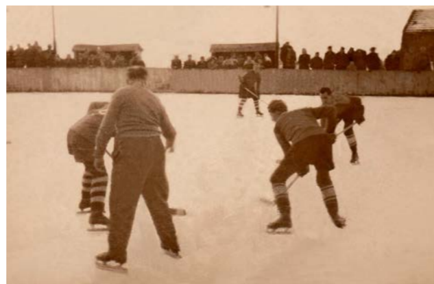
Zápas na putimském zimním stadionu na mlýnském náhonu pod čp. 29 (dnes Horníků).

V lednu jsme si povídali o tom, jak jsme se účastnili brigád v rámci akcí Z. Co to bylo? Byla to dobrovolná a bezplatná práce, kterou se pomáhalo při stavbě nějaké budovy v obci (u nás třeba hostince a kulturního domu) nebo při úklidu svého okolí. Písmeno „Z“ značilo zvelebování. Každoroční byl například úklid vršku kolem kostela – shrabování listí. Také se třeba upravoval záhon růží na návsi v parčíku před Šmidmajerů, pomáhalo se JZD při sběru brambor, uklízeli jsme novou hospodu U Cimbury před jejím otevřením. Většinou tyto akce vždy svolala nějaká organizace – Svaz mládeže, Svaz žen, i jiní. Ne, že bychom byli brigádou nadšení, ale nakonec tam byla