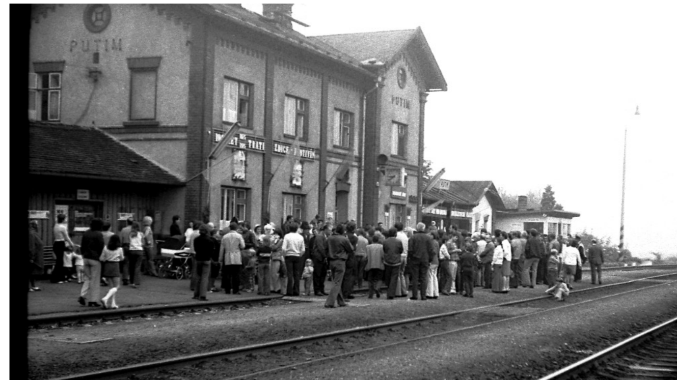
Při stém výročí v roce 1975 to byla opravdu velká akce s množstvím lidí, ve vlaku byli všichni v dobovém oblečení, nescházel ani Švejk, vojáci a také muzika.

Jak tomu tedy bylo před již zmíněnými 150 lety? Dne 20. prosince 1875 byl slavnostně zahájen provoz na trati Zdice – Protivín. Vlak byl na svou první cestu náležitě vyzdobený a ve stanicích ho vítalo zvědavé „obecenstvo“. Nejinak tomu bylo i v Putimi. Lidé s napětím, ale trochu i s obavami očekávali, až se objeví ohromná kouřící a hlučná lokomotiva s vagóny. Z komína se valil černý dým a z pod kol bílá pára. Hotová soptící příšera. Kdo by se odvážil do ní nasednout? A tak