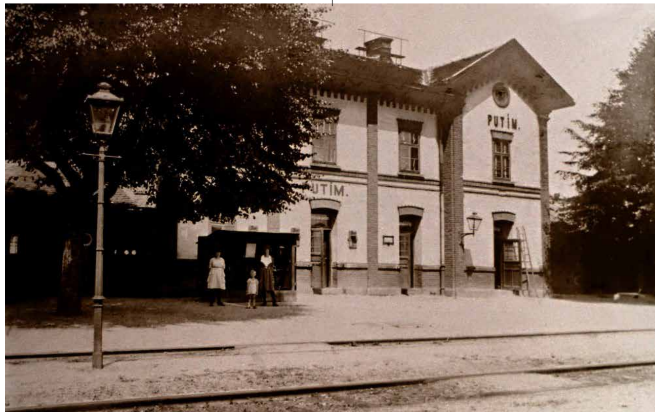
Putimské nádraží v roce 1922. Tenkrát ještě vypadalo trochu jinak – troje vstupní dveře, nápis Putim nad prvními dveřmi, nebyla přistavena část vpravo – přístřešek s WC, naopak vlevo stála boudička i další dřevěný přístavek.