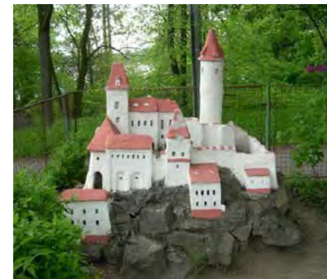
Není krásný ten putimský hrad?