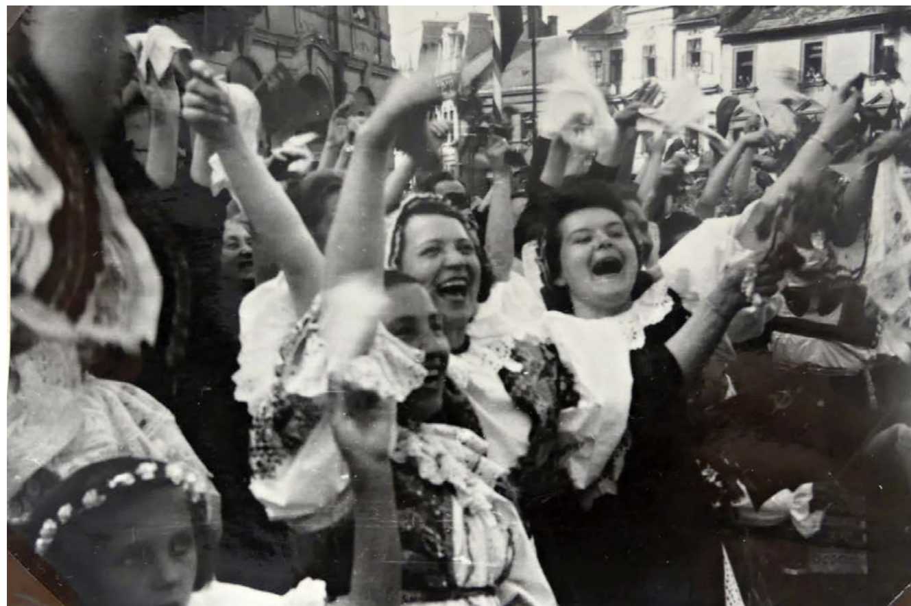
Vitání spojeneckých armád v Písku.

Národní stráž byla ubytována v hostinci u Píchů čp. 42, vysílala hlídky po okolí a s pomocí ruských a amerických vojáků sbírala potulující se zbytky německé branné moci. Byli mezi těmito zbytky zatvrzelci, kteří nechtěli věřit, že je konec německé slávy a moci a domnívali se, že svým falešným hrdinstvím proti českým civilistům zachrání ještě Německo. O tom svědčí tyto příhody: