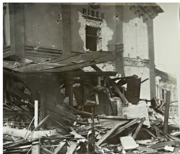
Bombardování píseckého nádraží 29. dubna 1945