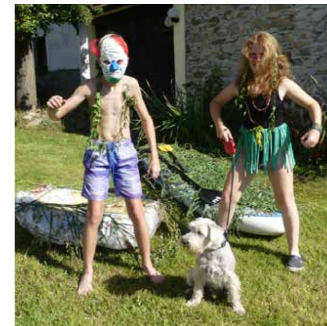
Domorodci z Pacifiku