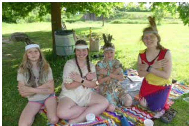
Mladí indiáni a indiánky