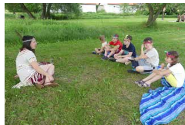
Indiánská babička vypráví pohádku