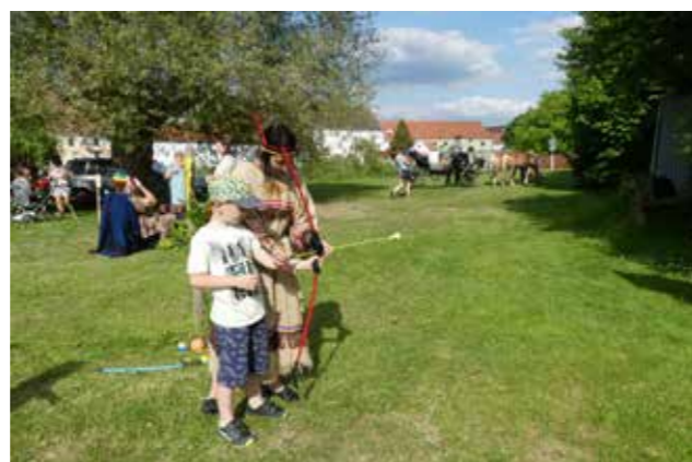
Střelba z luku