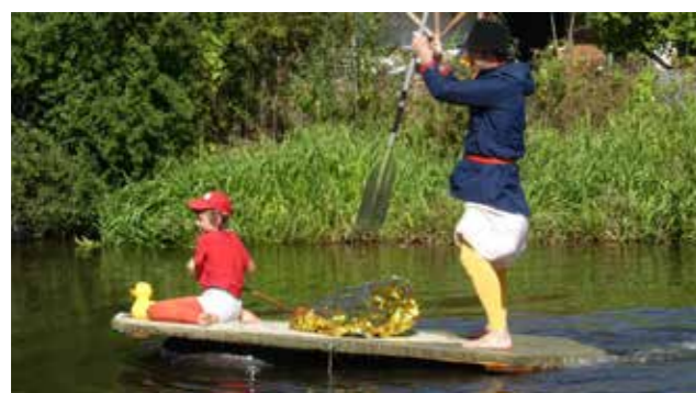
My z Kačerova 2