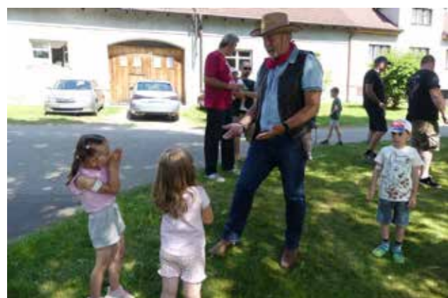
Šerif vítá půvabné pistolnice