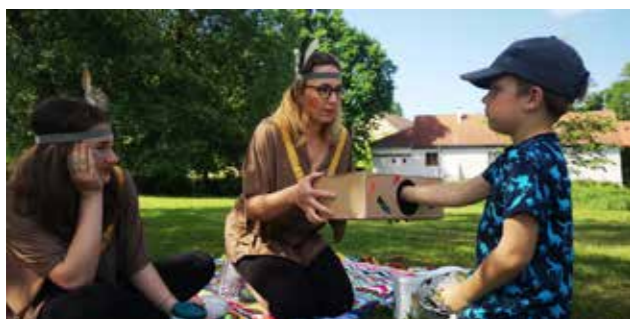
Bystření čichu a hmatu

Kolty proklatě nízko, zlatá horečka a touha mířit přesně.