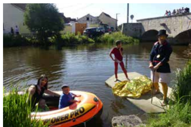
My z Kačerova