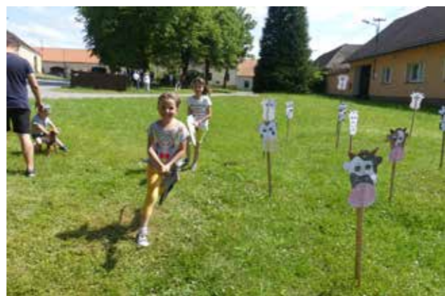
Shánění dobytčího stáda