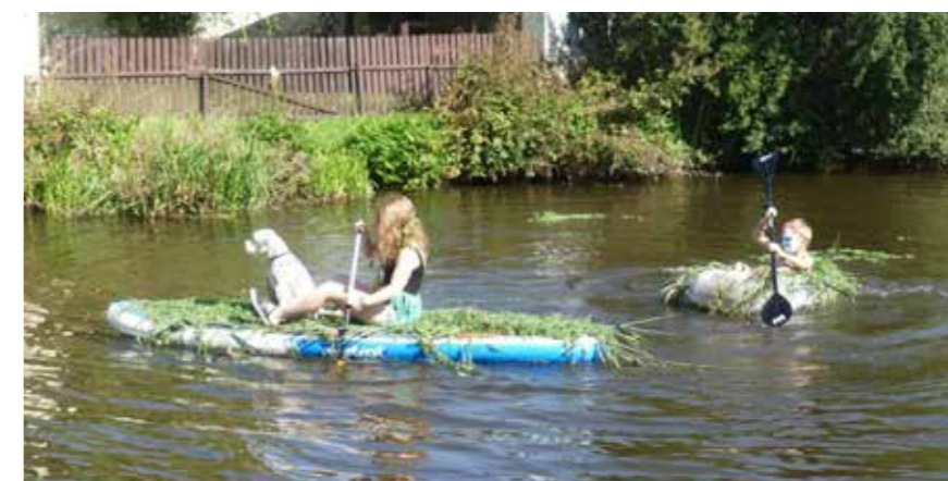
Domorodci z Pacifiku 2