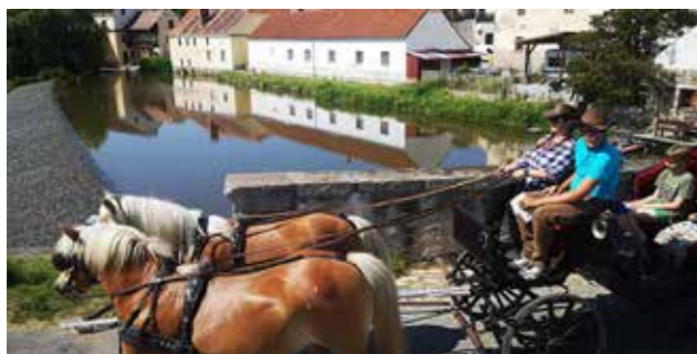
Dostavník řítící se putimskou plání