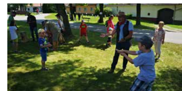
Pistolnický souboj se šerifem