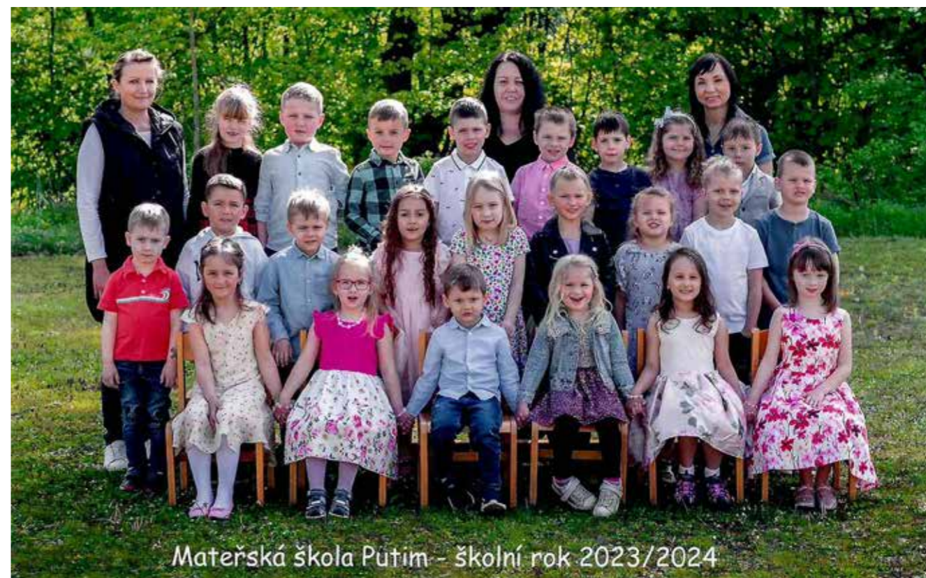
Mateřská škola Putim - školní rok 2023/2024

Jelikož 10 dětí ukončuje povinné předškolní vzdělávání a po prázdninách se z nich stanou školáci, poslední týden v červnu se s nimi slavnostně rozloučíme. Veškeré přípravy jsou v plném proudu a děti se pečlivě přípra-